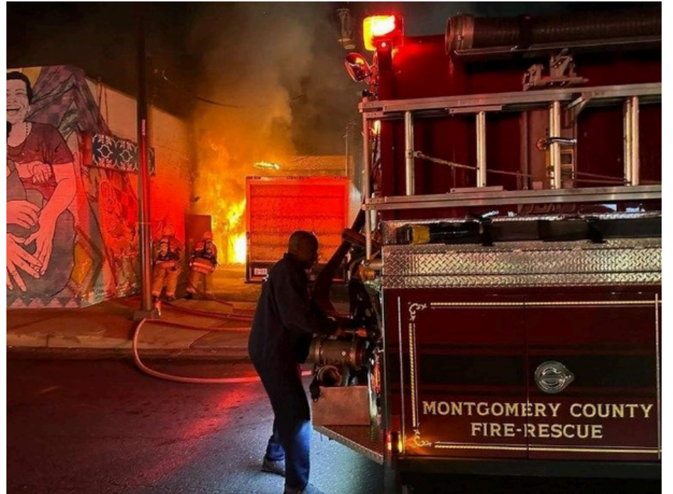
Fire rescuers arriving at the scene of a two-alarm fire that damaged CASA Furniture.

This fall, Long Branch businesses and the surrounding community have suffered several hard blows, with a large and damaging fire taking place in September, followed by the shooting death of an 18 year-old man in early October.