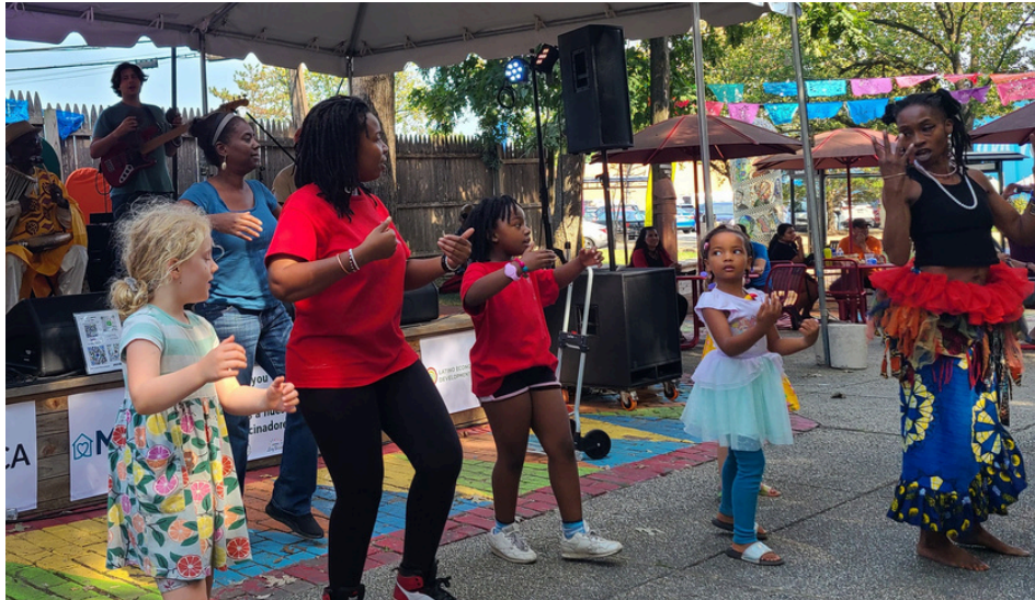
La banda Cheick Hamala Diabate en el festival Long Branch, 14 de septiembre de 2024.

“... el arte es algo que simultáneamente, una vez que le llega a la gente, las une.”