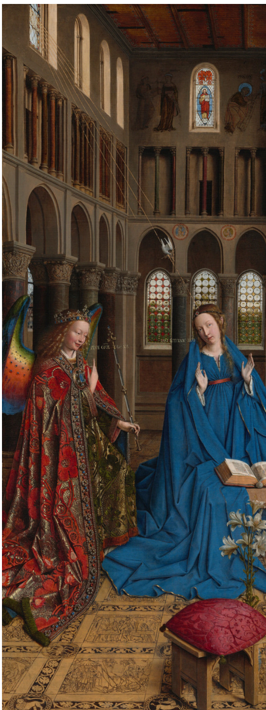
Below: Jan Van Eyck, the Annunciation, National Gallery of Art, Washington, D.C. (used with permission)

this time because of the ability of modern industrial machinery to mechanically reproduce unlimited reproductions of a work of art. Trivialization would be the result, along with boredom. After one has viewed the exact same Van Gogh painting in IKEA displays and college dorm rooms for the thousandth time, it no longer has the same impact. Benjamin, clearly, had a point.